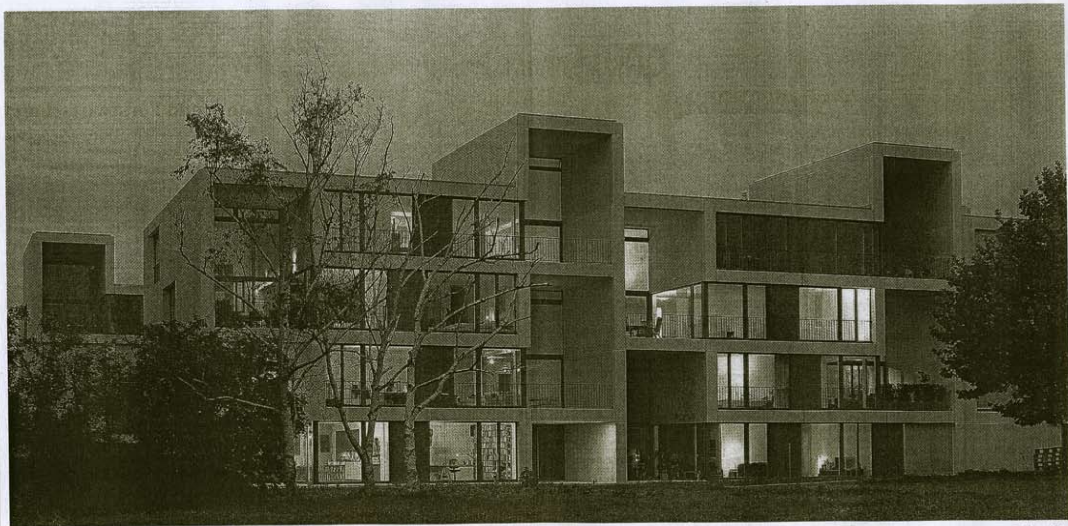
Pile-up-Wohnanlage im schweizerischen Rheinfelden: Jedes „L“ ist ein eigenes Haus, denn wer stapelt, nutzt die Fläche besser aus.