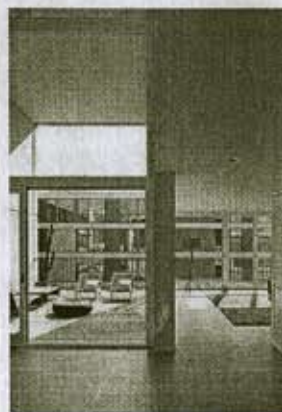
Haus in Rheinfelden: großzügiger Raumgefühl