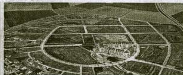
Gegen den ungebremsten Flächenfraß

Das Deutsche Architektur Zentrum DAZ zeigt die Ausstellung „Pile up - Zukunftslabor Wohnen“ noch bis zum 26. August. Köpenicker Straße 48/49, Berlin. www.daz.de